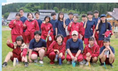
応援する会より頂いた体育着の記念写真

本会は、地域住民の方々により令和元年度に発足され、これまで、本校PR用ポスターや看板の制作、生徒へのマスクのご提供をしていただいております。また、発足以来、新入生への体育着を寄贈していただいています。東北六県生徒商業研究発表大会に出場の際は激励費を頂きました（写真中央）。たくさんの応援ありがとうございます。