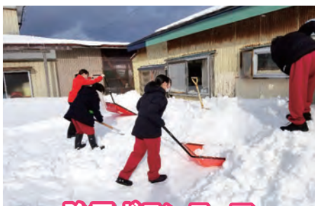
除雪ボランティア