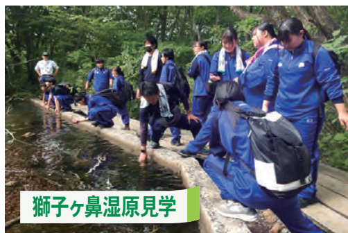
獅子ヶ鼻湿原見学

また、地元で生まれ育ってきてはいるものの、地域の良さや魅力にはなかなか気づきにくいものです。そうした魅力を再発見できるのも、矢島の学びならではの魅力です。矢島高校の総合的な探究「鳥海探究Ⅰ・Ⅱ・Ⅲ」は、地域の事を、地域をテーマに、地域の将来を、真剣に探究します。