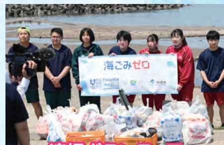
清掃ボランティア