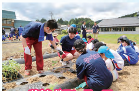
花植ボランティア