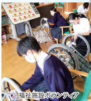
福祉施設ボランティア