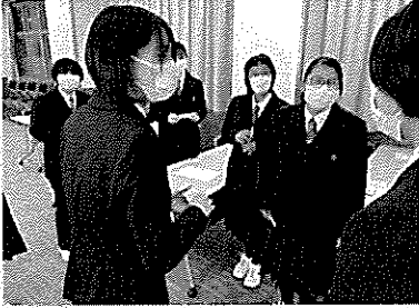
3年生 スーツ着こなしセミナー