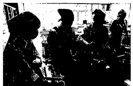
3年フードデザインの授業