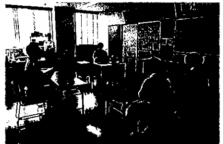
茶道部の活動の様子