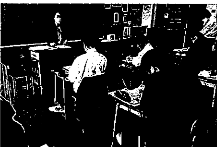
3年の進路ガイダンス