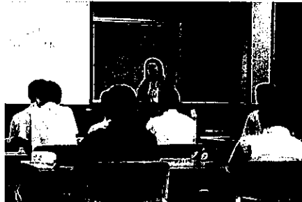
6/14 歯科講話(2年) 「歯周病の発生要因や歯の大切さ」について講話をいただきました