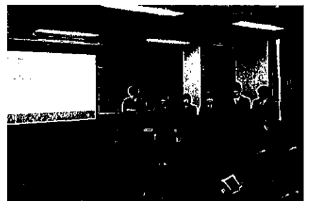
5/11 鳥海探究Ⅲ学習発表会(3年) 昨年度グループ別に学習した内容を全校生徒の前でプレゼンテーションしました

6/13 ひまわりプロジェクトボランティア 今年度は全校で旧矢島高校跡地に、矢島小学校・矢島中学校の生徒の皆さんとひまわりの苗を植えました