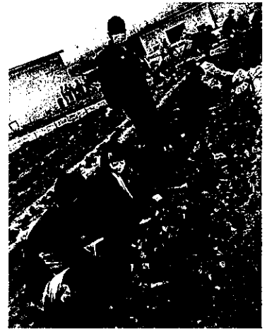
5/9 森林教室(1年) 水林にある国有林にて松林の調整伐を行いました